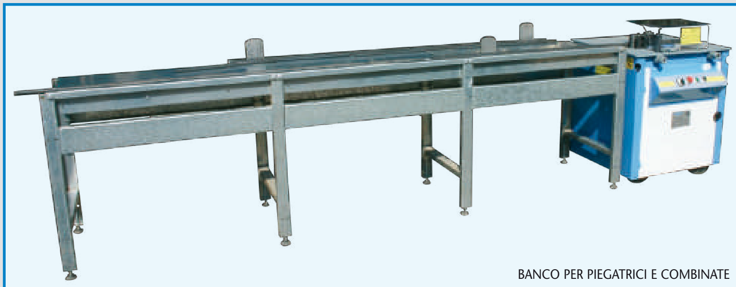
BANCO PER PIEGATRICI E COMBinate